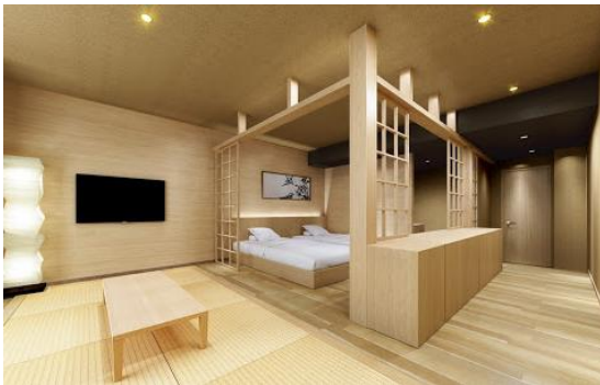
こだわりの和洋室一例