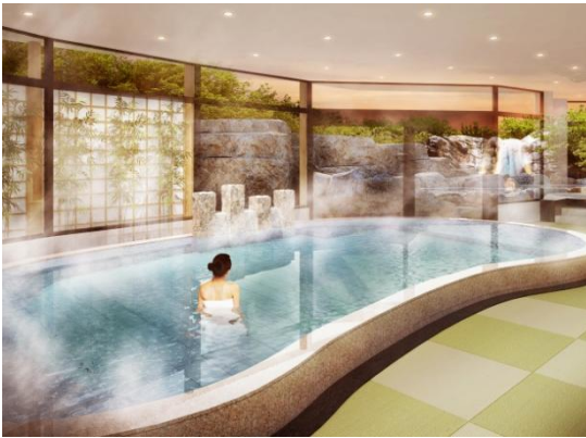
大浴場は全面畳敷きへ