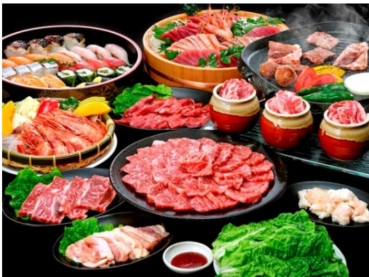
熊野牛をはじめとする高級食材が食べ放題