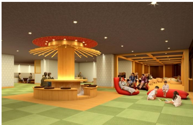
「庭園と穏やかな海に包まれる和みの宿」がコンセプト